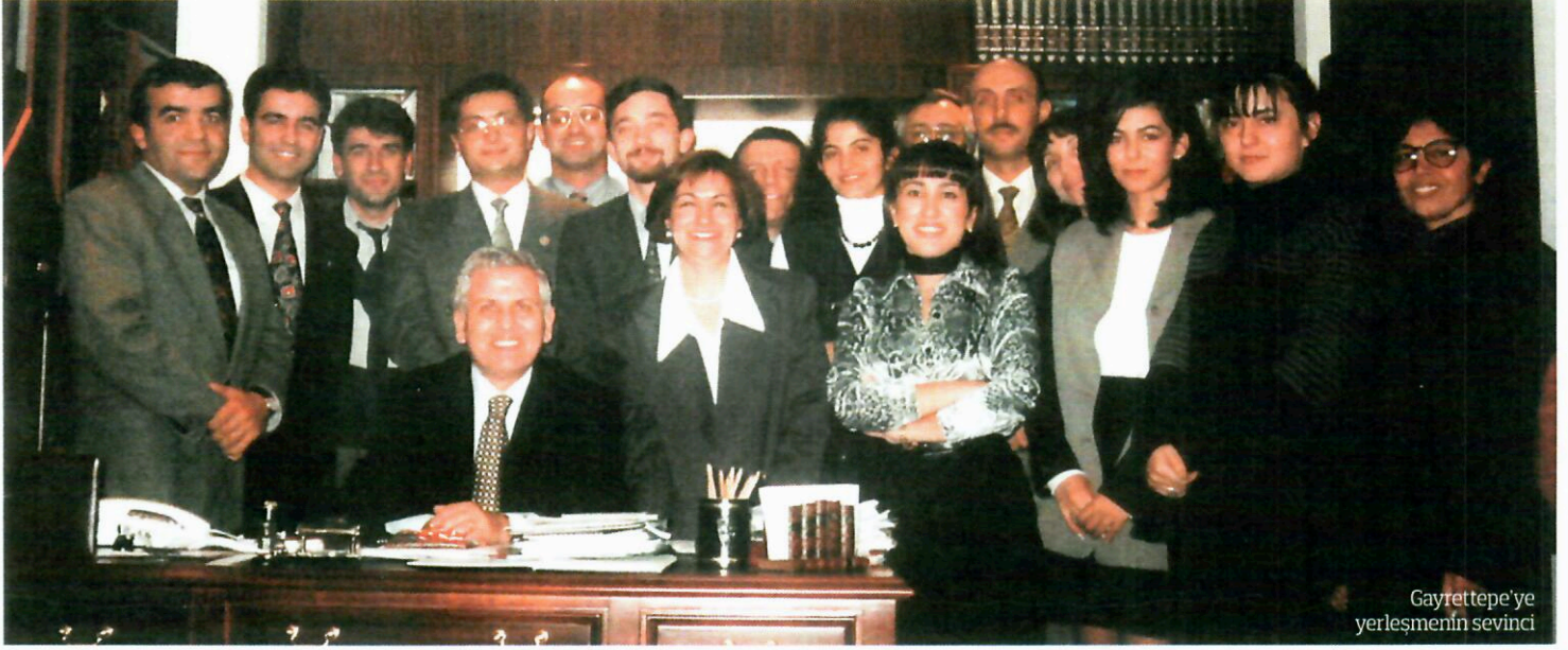
Gayrettepe'ye yerleşmenin sevinci