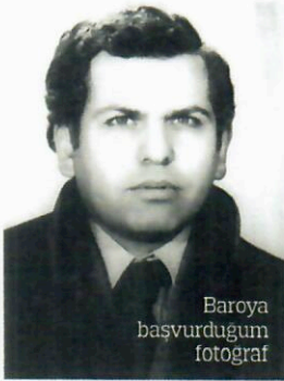
Baro'ya başvurduğum fotoğraf