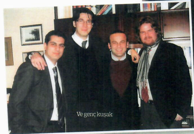
Ve genç kuşak