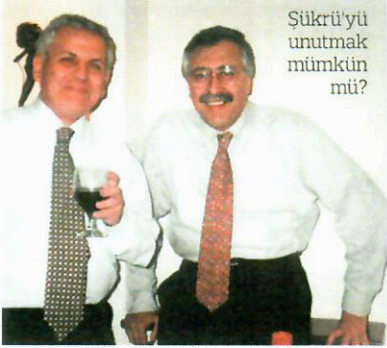
Sükrü'yi unutmak mümkün mü?